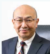
美萩野女子高等学校 校長